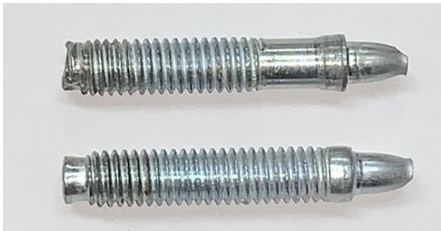
Figura B.3 Imagen de las muestras posterior al ensayo realizado.

En la figura B.3 se muestra una imagen de las muestras después de realizado el ensayo.