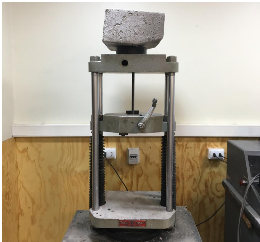
Figura B.2 Imagen del montaje utilizado para realizar el ensayo.

Finalmente se realizó el ensayo de tracción empleando una velocidad de 10 mm/mín. El montaje utilizado para realizar el ensayo se muestra en la figura B.2.