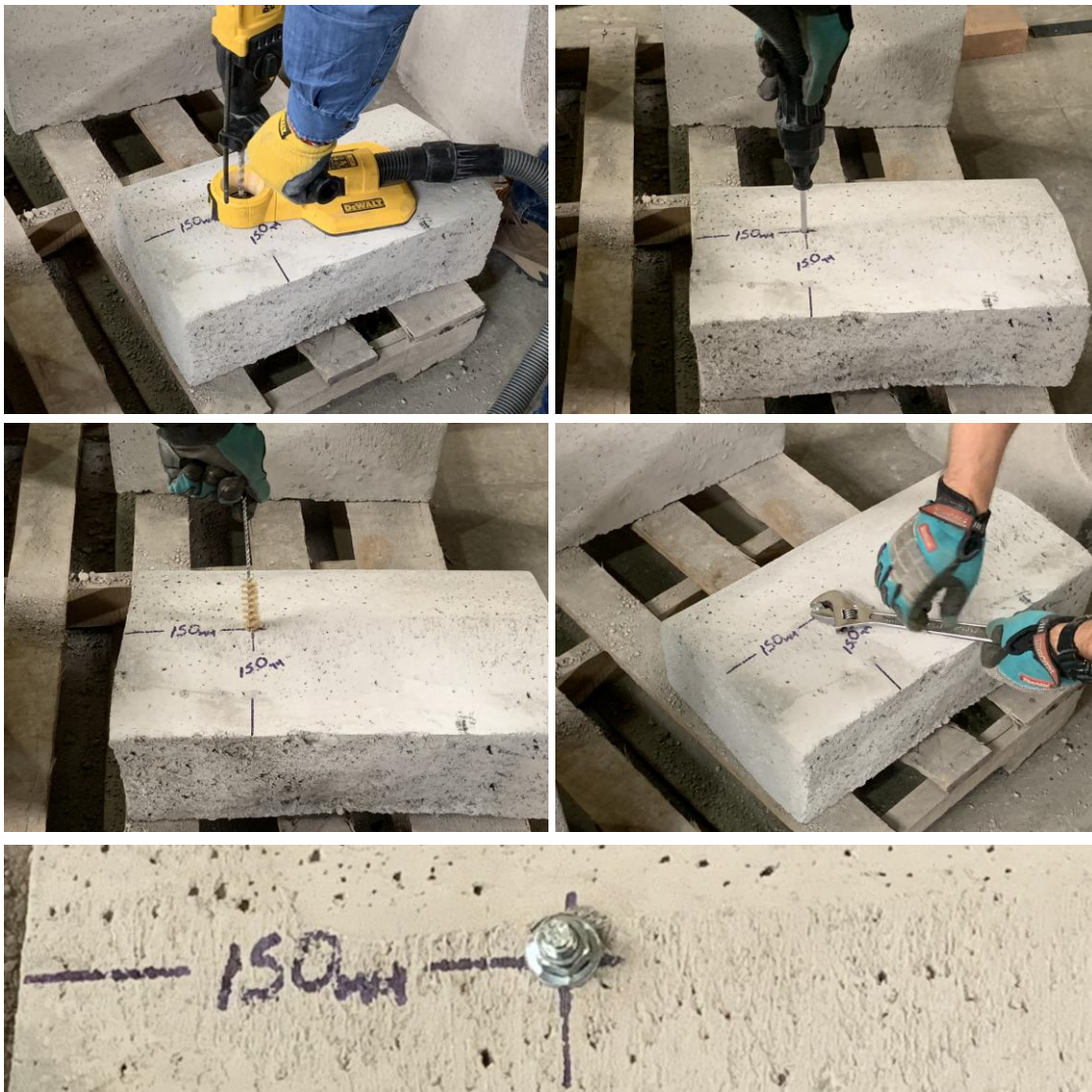
Figura B.1 Imagen del proceso de limpieza e instalación de las muestras recibidas.

Para realizar los ensayos de tracción de las muestras recibidas, se procedió a instalar los pernos de expansión en una solera de hormigón H30 aportado por el cliente. Para la instalación, se realizó un proceso de perforación con taladro manual, con un orificio del diámetro nominal del perno de expansión, posteriormente el orificio fue aspirado y cepillado. A continuación, se instaló el perno en el hormigón y se torqueó de manera manual. La figura B.1 muestra imágenes del proceso de limpieza e instalación de las muestras recibidas.