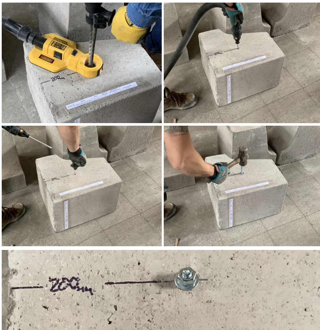
Figura B.1 Imagen del proceso de limpieza e instalación de las muestras recibidas.

Para realizar los ensayos de tracción de las muestras recibidas, se procedió a instalar los pernos de expansión en una solera de hormigón H30 aportado por el cliente. Para la instalación, se realizó un proceso de perforación con taladro manual, con un orificio del diámetro nominal del perno de expansión, posteriormente el orificio fue aspirado y cepillado. A continuación, se instaló el perno en el hormigón y se torqueó de manera manual. La figura B.1 muestra imágenes del proceso de limpieza e instalación de las muestras recibidas.