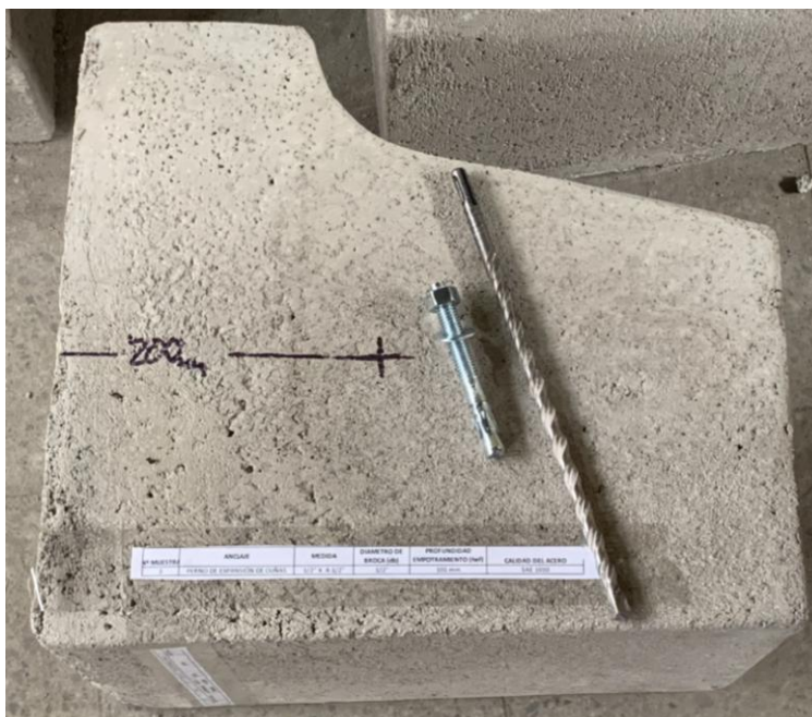
Figura A.1 Imagen de las muestras recibidas.

En la figura A.1 se presenta una imagen de las muestras recibidas, junto a una solera de hormigón H30 aportado por el cliente, el cual fue utilizado para realizar los ensayos. Los cuales fueron realizados en duplicado.