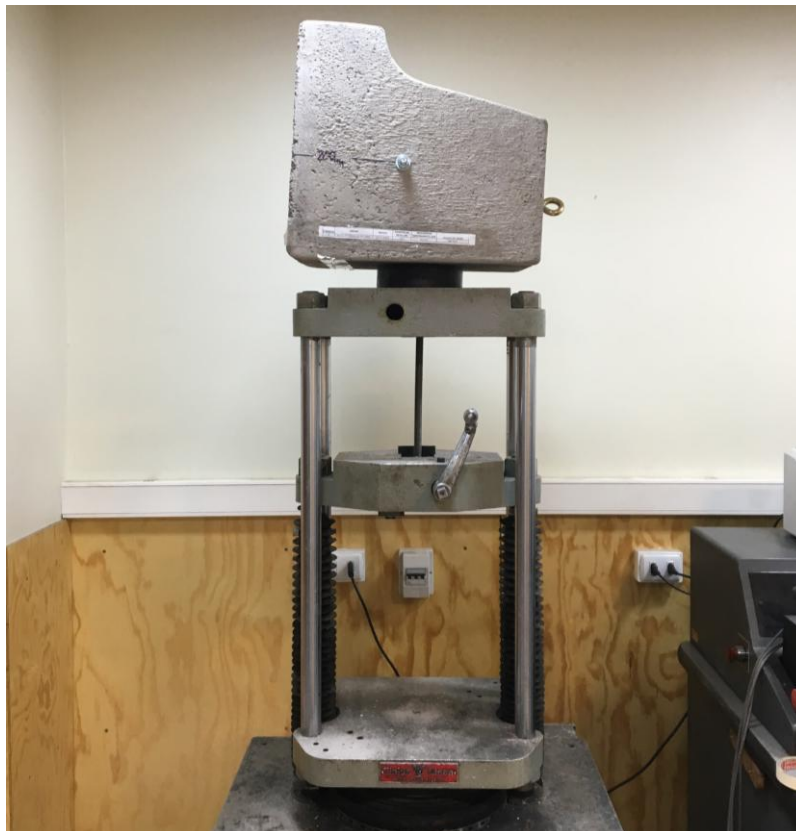
Figura B.2 Imagen del montaje utilizado para realizar el ensayo.

Finalmente se realizó el ensayo de tracción empleando una velocidad de 10 mm/mín. El montaje utilizado para realizar el ensayo se muestra en la figura B.2.