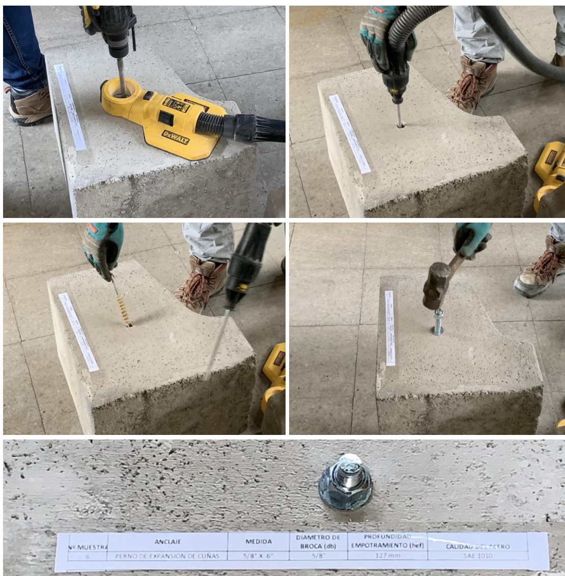
Figura B.1 Imagen del proceso de limpieza e instalación de las muestras recibidas.

Para realizar los ensayos de tracción de las muestras recibidas, se procedió a instalar los pernos de expansión en una solera de hormigón H30 aportado por el cliente. Para la instalación, se realizó un proceso de perforación con taladro manual, con un orificio del diámetro nominal del perno de expansión, posteriormente el orificio fue aspirado y cepillado. A continuación, se instaló el perno en el hormigón y se torqueó de manera manual. La figura B.1 muestra imágenes del proceso de limpieza e instalación de las muestras recibidas.