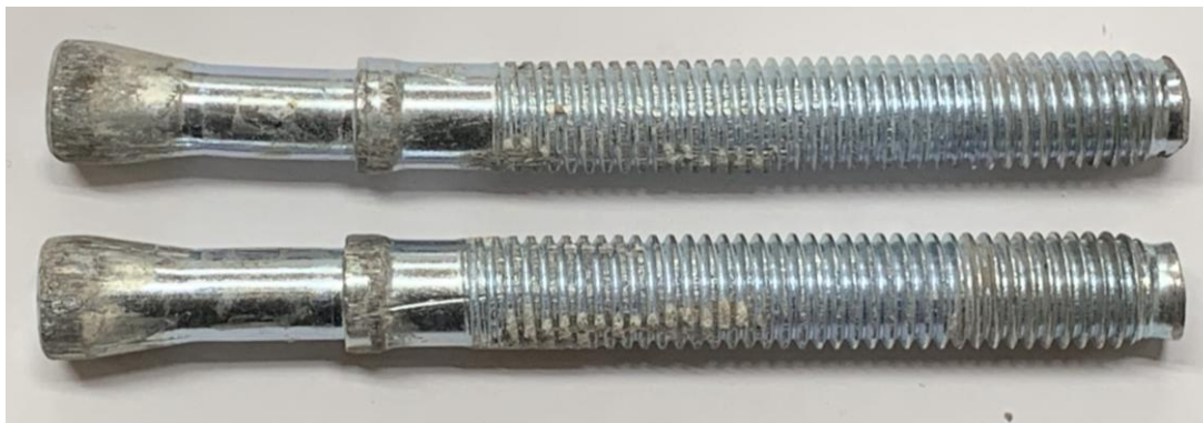
Figura B.3 Imagen de las muestras posterior al ensayo realizado.

En la figura B.3 se muestra una imagen de las muestras después de realizado el ensayo.