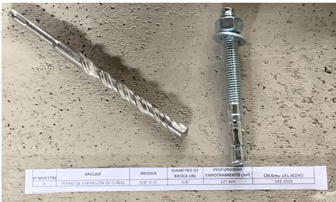
Figura A.1 Imagen de las muestras recibidas.

En la figura A.1 se presenta una imagen de las muestras recibidas, junto a una solera de hormigón H30 aportado por el cliente, el cual fue utilizado para realizar los ensayos. Los cuales fueron realizados en duplicado.