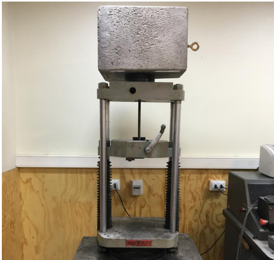
Figura B.2 Imagen del montaje utilizado para realizar el ensayo.

Finalmente se realizó el ensayo de tracción empleando una velocidad de 10 mm/mín. El montaje utilizado para realizar el ensayo se muestra en la figura B.2.