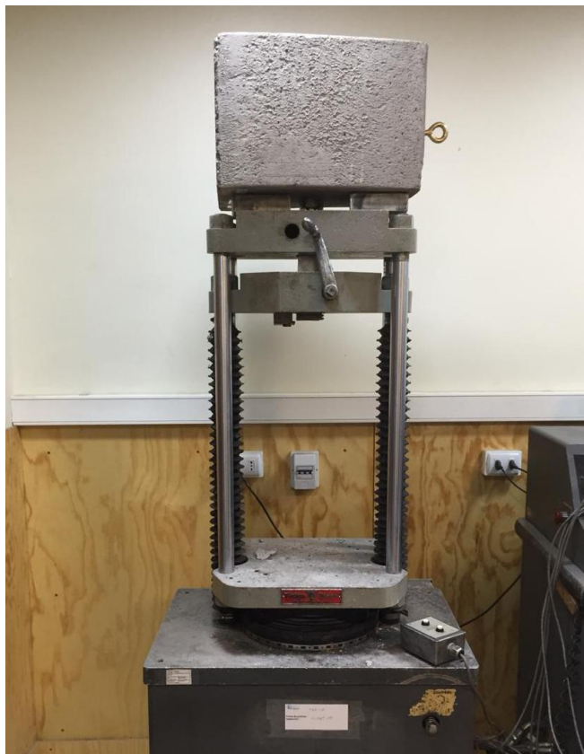
Figura B.2 Imagen del montaje utilizado para realizar el ensayo.

Finalmente se realizó el ensayo de tracción empleando una velocidad de 10 mm/mín. El montaje utilizado para realizar el ensayo se muestra en la figura B.2.