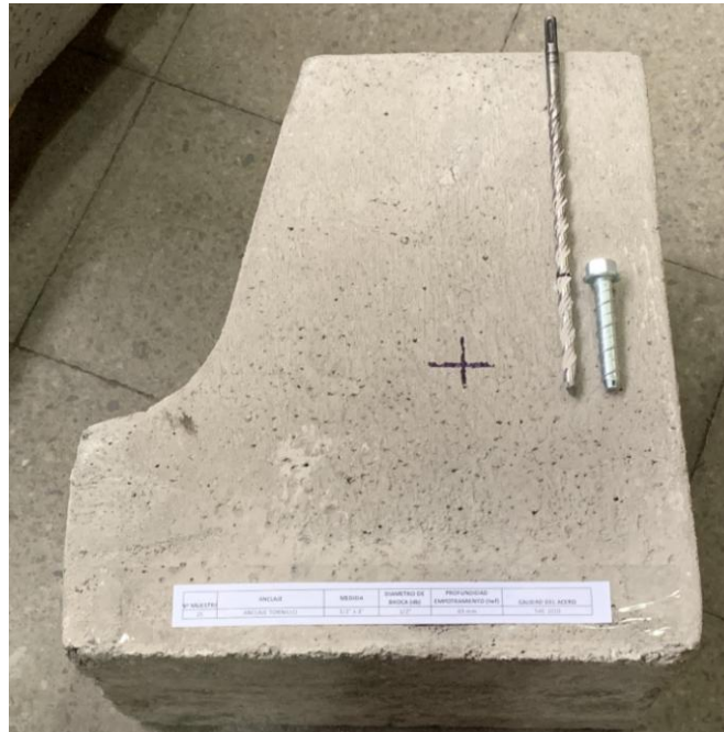
Figura A.1 Imagen de las muestras recibidas.

En la figura A.1 se presenta una imagen de las muestras recibidas, junto a una solera de hormigón H30 aportado por el cliente, el cual fue utilizado para realizar los ensayos. Los cuales fueron realizados en duplicado.