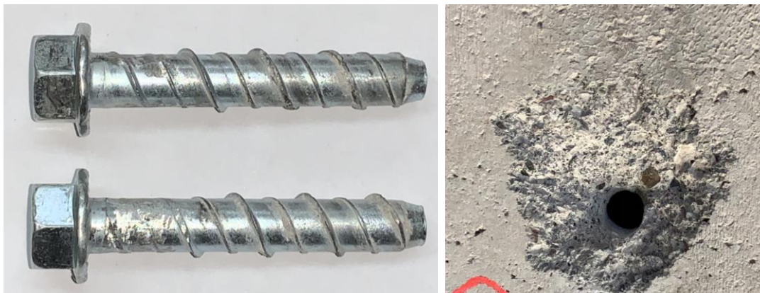
Figura B.3 Imagen de las muestras posterior al ensayo realizado.

En la figura B.3 se muestra una imagen de las muestras después de realizado el ensayo.