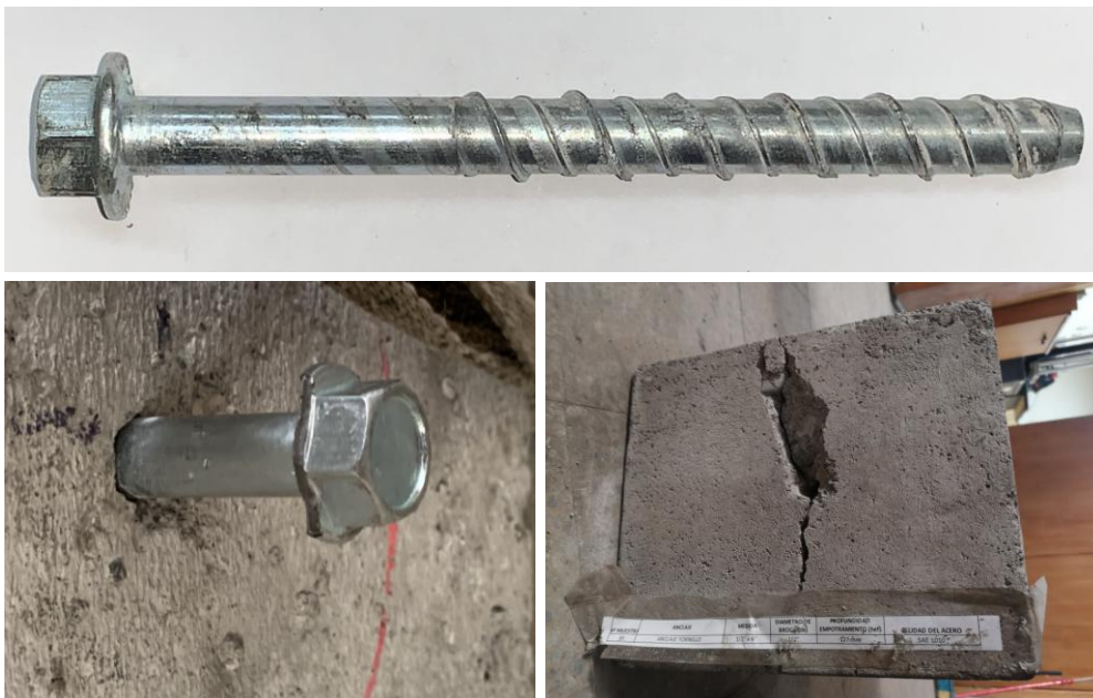
Figura B.3 Imagen de las muestras posterior al ensayo realizado.

En la figura B.3 se muestra una imagen de las muestras después de realizado el ensayo.