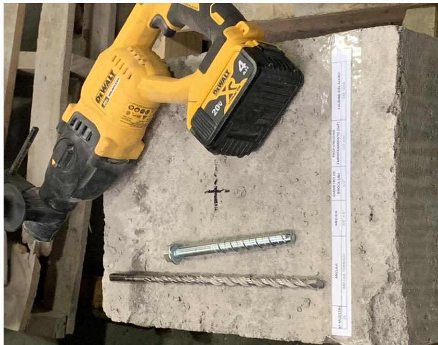
Figura A.1 Imagen de las muestras recibidas.

En la figura A.1 se presenta una imagen de las muestras recibidas, junto a una solera de hormigón H30 aportado por el cliente, el cual fue utilizado para realizar los ensayos. Los cuales fueron realizados en duplicado.