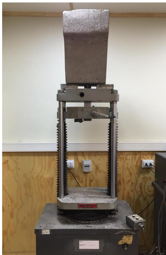
Figura B.2 Imagen del montaje utilizado para realizar el ensayo.

Finalmente se realizó el ensayo de tracción empleando una velocidad de 10 mm/mín. El montaje utilizado para realizar el ensayo se muestra en la figura B.2.