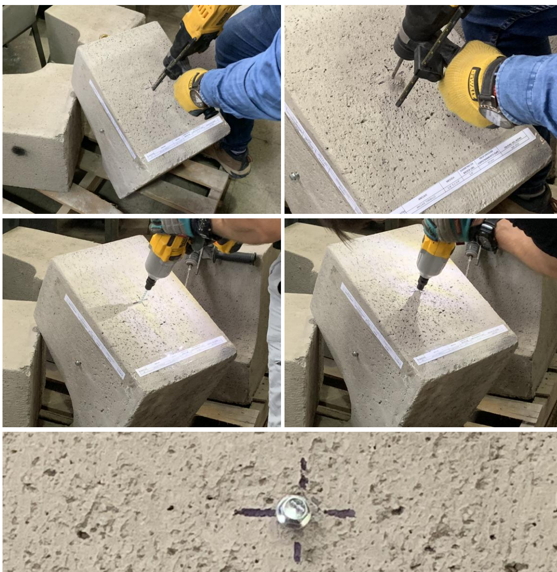
Figura B.1 Imagen del proceso de instalación de las muestras recibidas.

Para realizar los ensayos de tracción de las muestras recibidas, se procedió a instalar los anclajes en una solera de hormigón H30 aportado por el cliente. Para la instalación, se realizó un proceso de perforación con taladro manual, con un orificio del diámetro nominal del anclaje. A continuación, se instaló el anclaje en el hormigón con el uso de una llave de impacto. La figura B.1 muestra imágenes del proceso de instalación de las muestras recibidas.