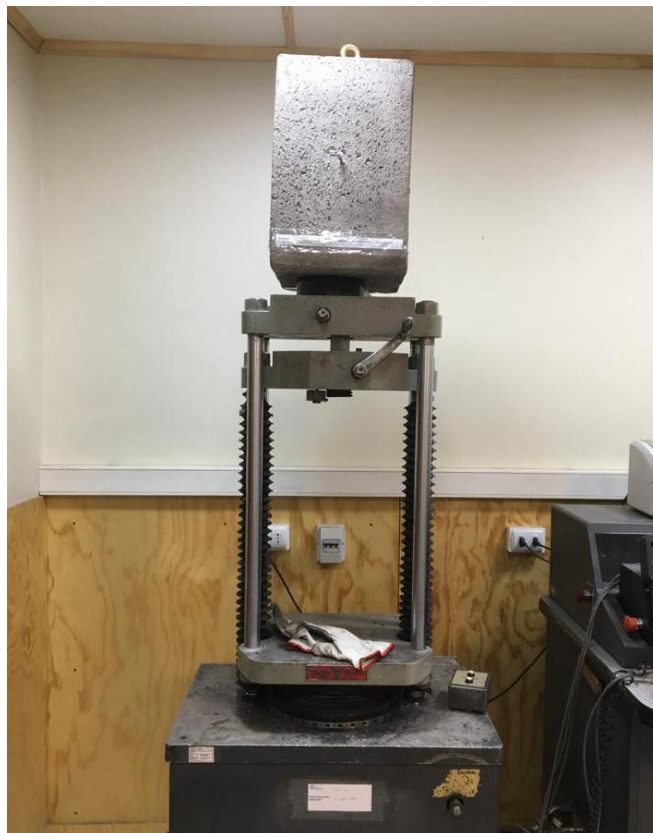
Figura B.2 Imagen del montaje utilizado para realizar el ensayo.

Finalmente se realizó el ensayo de tracción empleando una velocidad de 10 mm/mín. El montaje utilizado para realizar el ensayo se muestra en la figura B.2.