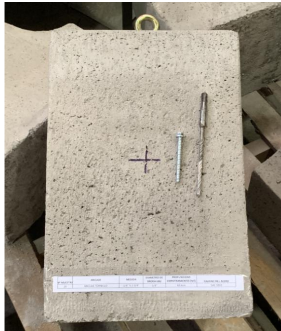
Figura A.1 Imagen de las muestras recibidas.

En la figura A.1 se presenta una imagen de las muestras recibidas, junto a una solera de hormigón H30 aportado por el cliente, el cual fue utilizado para realizar los ensayos. Los cuales fueron realizados en duplicado.