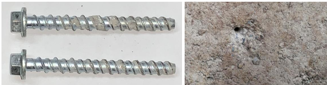
Figura B.3 Imagen de las muestras posterior al ensayo realizado.

En la figura B.3 se muestra una imagen de las muestras después de realizado el ensayo.