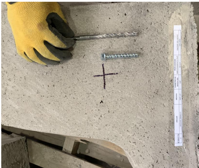
Figura A.1 Imagen de las muestras recibidas.

En la figura A.1 se presenta una imagen de las muestras recibidas, junto a una solera de hormigón H30 aportado por el cliente, el cual fue utilizado para realizar los ensayos. Los cuales fueron realizados en duplicado.