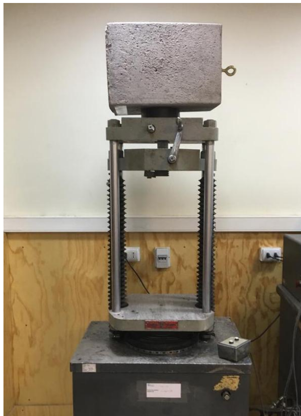
Figura B.2 Imagen del montaje utilizado para realizar el ensayo.

Finalmente se realizó el ensayo de tracción empleando una velocidad de 10 mm/mín. El montaje utilizado para realizar el ensayo se muestra en la figura B.2.