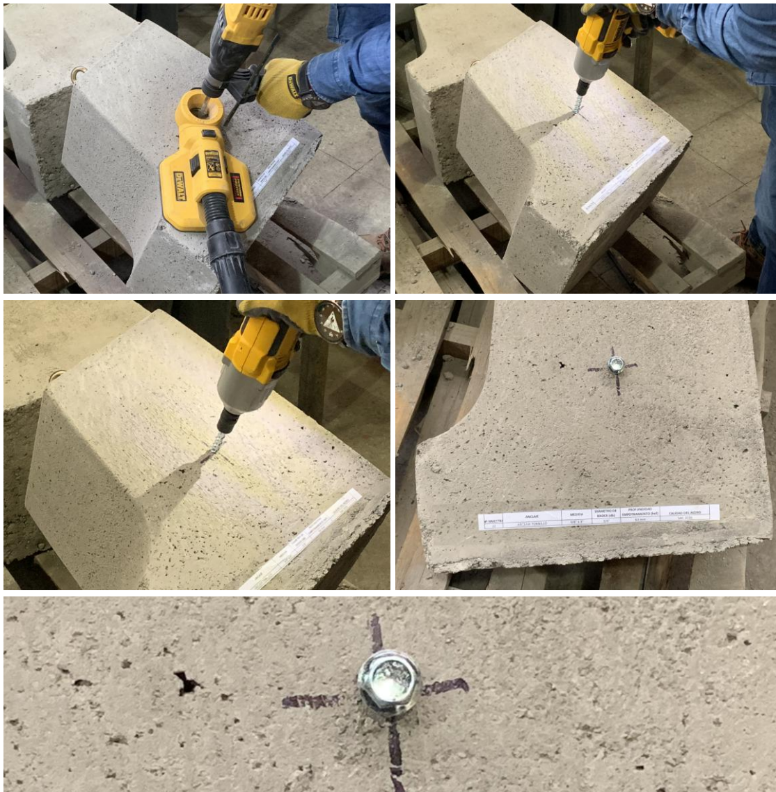
Figura B.1 Imagen del proceso de instalación de las muestras recibidas.

Para realizar los ensayos de tracción de las muestras recibidas, se procedió a instalar los anclajes en una solera de hormigón H30 aportado por el cliente. Para la instalación, se realizó un proceso de perforación con taladro manual. A continuación, se instaló el anclaje en el hormigón con el uso de una llave de impacto. La figura B.1 muestra imágenes del proceso de instalación de las muestras recibidas.