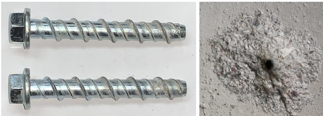
Figura B.3 Imagen de las muestras posterior al ensayo realizado.

En la figura B.3 se muestra una imagen de las muestras después de realizado el ensayo.