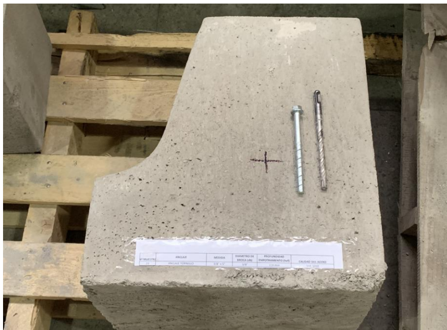
Figura A.1 Imagen de las muestras recibidas.

En la figura A.1 se presenta una imagen de las muestras recibidas, junto a una solera de hormigón H30 aportado por el cliente, el cual fue utilizado para realizar los ensayos. Los cuales fueron realizados en duplicado.