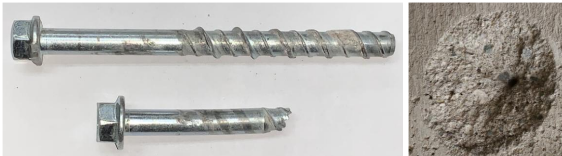
Figura B.3 Imagen de las muestras posterior al ensayo realizado.

En la figura B.3 se muestra una imagen de las muestras después de realizado el ensayo.