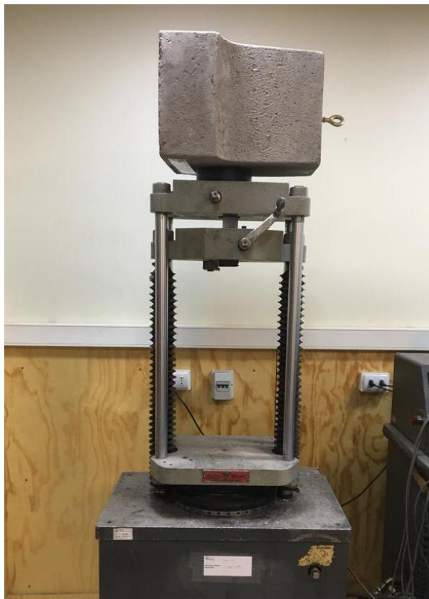
Figura B.2 Imagen del montaje utilizado para realizar el ensayo.

Finalmente se realizó el ensayo de tracción empleando una velocidad de 10 mm/mín. El montaje utilizado para realizar el ensayo se muestra en la figura B.2.