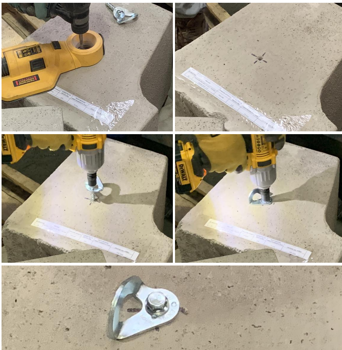
Figura B.1 Imagen del proceso de limpieza e instalación de las muestras recibidas.

Para realizar los ensayos de tracción de las muestras recibidas, se procedió a instalar los anclajes en una solera de hormigón H30 aportado por el cliente. Para la instalación, se realizó un proceso de perforación con taladro manual, A continuación, se instaló el anclaje en el hormigón con el uso de una llave de impacto. La figura B.1 muestra imágenes del proceso de instalación de las muestras recibidas.