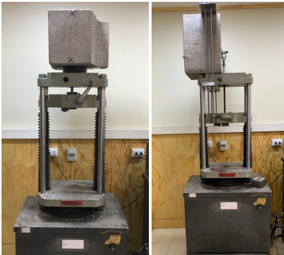
Figura B.2 Imagen del montaje utilizado para realizar el ensayo.

Finalmente se realizó el ensayo de tracción empleando una velocidad de 10 mm/mín. El montaje utilizado para realizar el ensayo se muestra en la figura B.2.