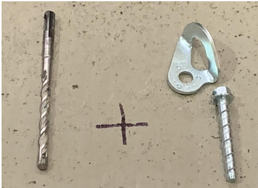
Figura A.1 Imagen de las muestras recibidas.

En la figura A.1 se presenta una imagen de las muestras recibidas, junto a una solera de hormigón H30 aportado por el cliente, el cual fue utilizado para realizar los ensayos. Los cuales fueron realizados en duplicado. Adicionalmente, se realizará un ensayo de corte.