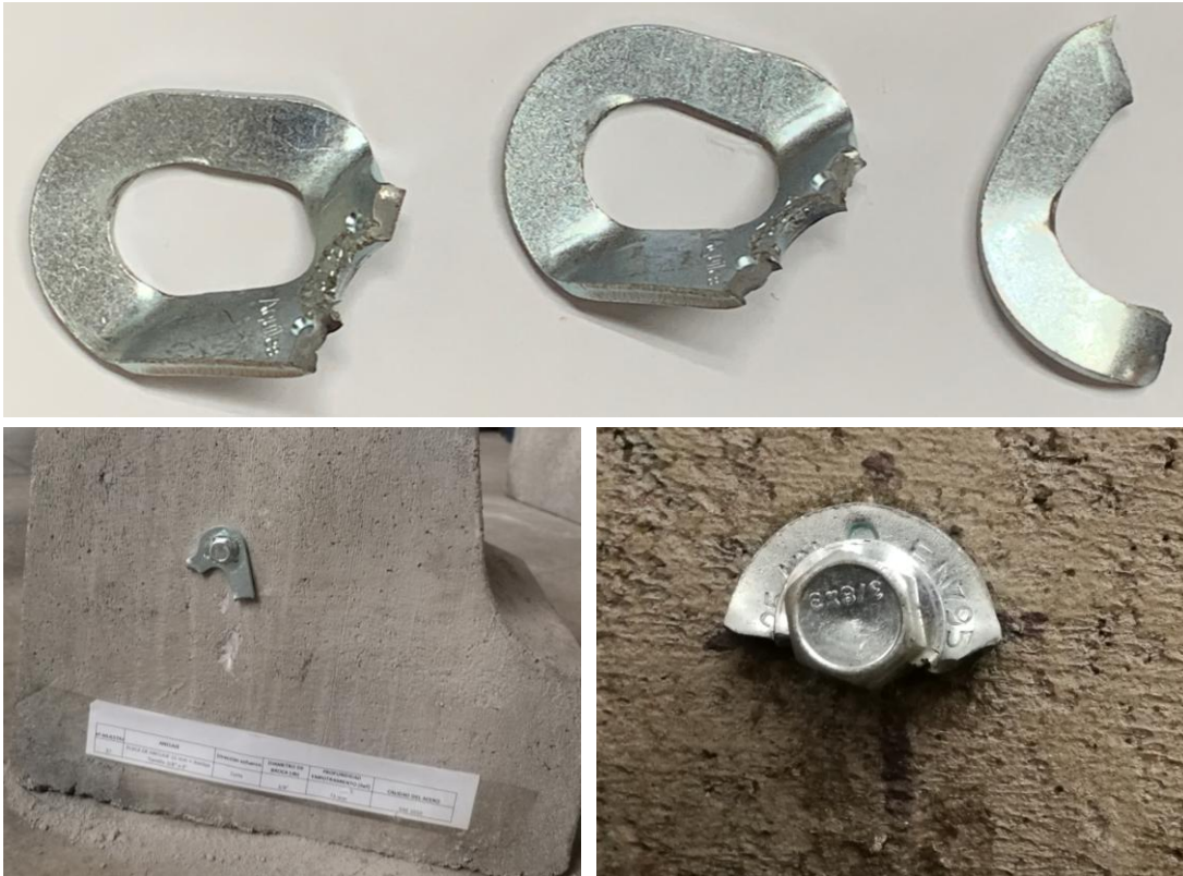
Figura B.3 Imagen de las muestras posterior al ensayo realizado.

En la figura B.3 se muestra una imagen de las muestras después de realizado el ensayo.