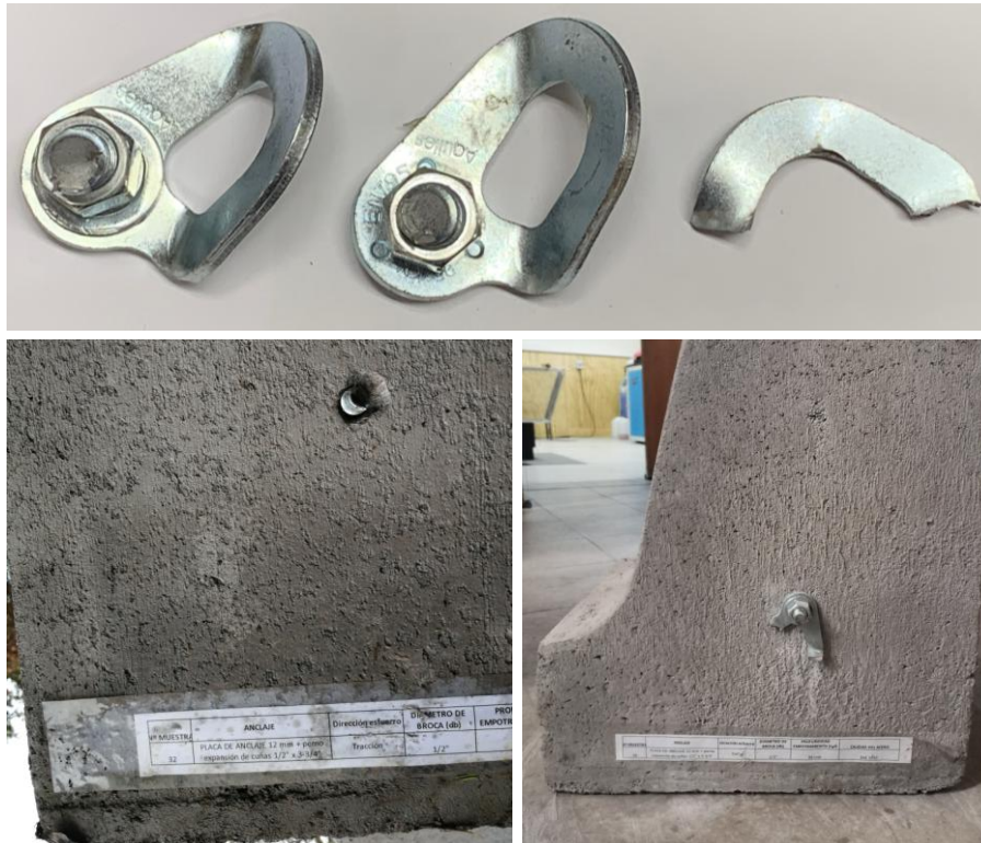
Figura B.3 Imagen de las muestras posterior al ensayo realizado.

En la figura B.3 se muestra una imagen de las muestras después de realizado el ensayo.