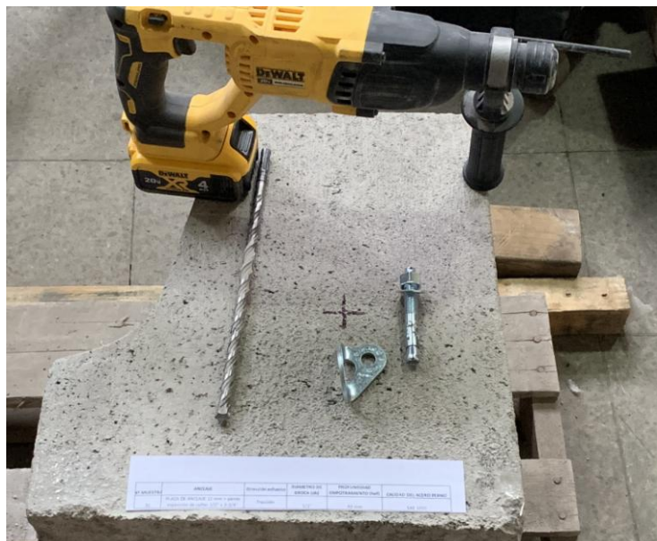
Figura A.1 Imagen de las muestras recibidas.

En la figura A.1 se presenta una imagen de las muestras recibidas, junto a una solera de hormigón H30 aportado por el cliente, el cual fue utilizado para realizar los ensayos. Los cuales fueron realizados en duplicado. Adicionalmente, se realizó un ensayo de corte.