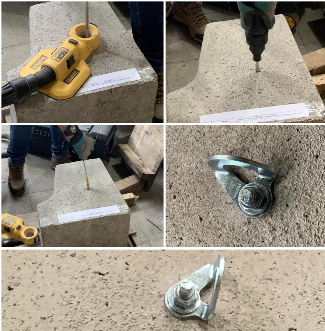
Figura B.1 Imagen del proceso de limpieza e instalación de las muestras recibidas.

Para realizar los ensayos de tracción de las muestras recibidas, se procedió a instalar los anclajes en una solera de hormigón H30 aportado por el cliente. Para la instalación, se realizó un proceso de perforación con taladro manual, con un orificio del diámetro nominal del anclaje, posteriormente el orificio fue aspirado y cepillado. A continuación, se instaló el anclaje en el hormigón y se torquéó de manera manual. La figura B.1 muestra imágenes del proceso de limpieza e instalación de las muestras recibidas.