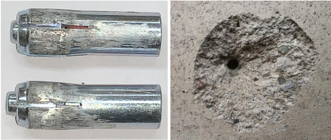
Figura B.3 Imagen de las muestras posterior al ensayo realizado.

En la figura B.3 se muestra una imagen de las muestras después de realizado el ensayo.