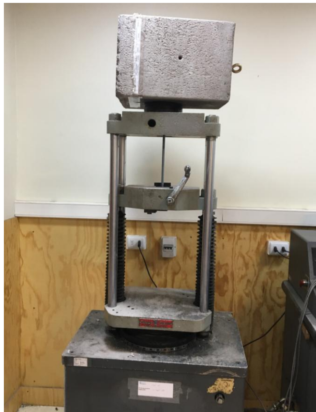
Figura B.2 Imagen del montaje utilizado para realizar el ensayo.

Finalmente se realizó el ensayo de tracción empleando una velocidad de 10 mm/mín. El montaje utilizado para realizar el ensayo se muestra en la figura B.2.