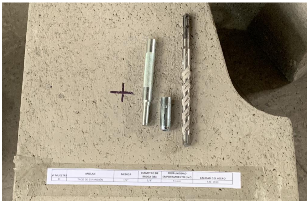
Figura A.1 Imagen de las muestras recibidas.

En la figura A.1 se presenta una imagen de las muestras recibidas, junto a una solera de hormigón H30 aportado por el cliente, el cual fue utilizado para realizar los ensayos. Los cuales fueron realizados en duplicado.