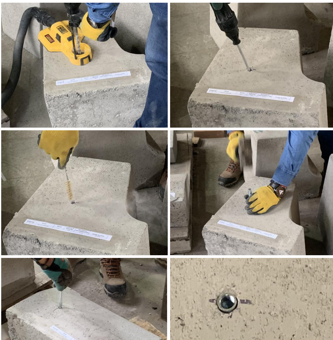
Figura B.1 Imagen del proceso de limpieza e instalación de las muestras recibidas.

Para realizar los ensayos de tracción de las muestras recibidas, se procedió a instalar los tacos de expansión en una solera de hormigón H30 aportado por el cliente. Para la instalación, se realizó un proceso de perforación con taladro manual de 5/8", posteriormente el orificio fue aspirado y cepillado. A continuación, se instaló el taco en el hormigón. Se expande con el uso de un expandidor . La figura B.1 muestra imágenes del proceso de limpieza e instalación de las muestras recibidas.