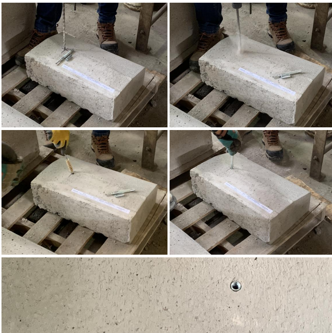
Figura B.1 Imagen del proceso de limpieza e instalación de las muestras recibidas.

Para realizar los ensayos de tracción de las muestras recibidas, se procedió a instalar los tacos de expansión en una solera de hormigón H30 aportado por el cliente. Para la instalación, se realizó un proceso de perforación con taladro manual de 1/2", posteriormente el orificio fue aspirado y cepillado. A continuación, se instaló el taco en el hormigón. Se expande con el uso de un expandidor. La figura B.1 muestra imágenes del proceso de limpieza e instalación de las muestras recibidas.