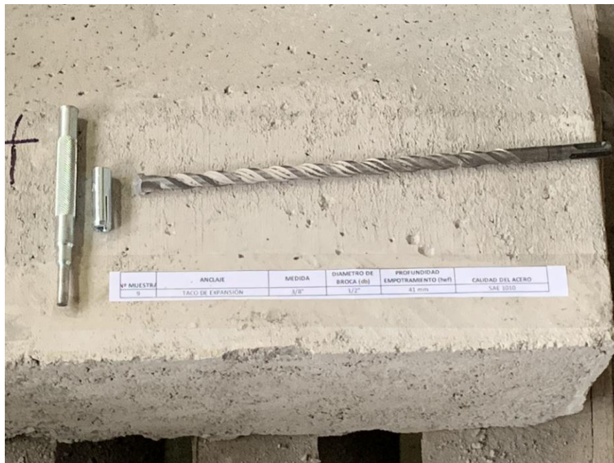
Figura A.1 Imagen de las muestras recibidas.

En la figura A.1 se presenta una imagen de las muestras recibidas, junto a una solera de hormigón H30 aportado por el cliente, el cual fue utilizado para realizar los ensayos. Los cuales fueron realizados en duplicado.