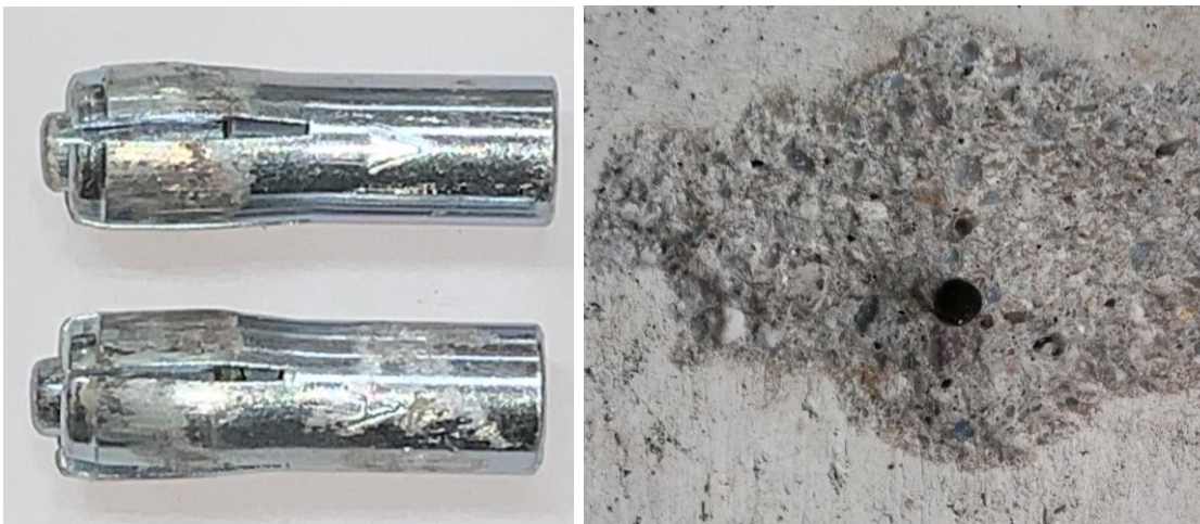
Figura B.3 Imagen de las muestras posterior al ensayo realizado.

En la figura B.3 se muestra una imagen de las muestras después de realizado el ensayo.