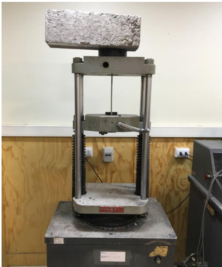
Figura B.2 Imagen del montaje utilizado para realizar el ensayo.

Finalmente se realizó el ensayo de tracción empleando una velocidad de 10 mm/mín. El montaje utilizado para realizar el ensayo se muestra en la figura B.2.